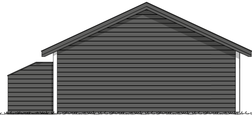
Fasade 4 1:100

Areal: Gr. Fl. Totalt: 121,6m 2 BYA Totalt: 128,0m 2 BRA pr leil.: 53,1m 2